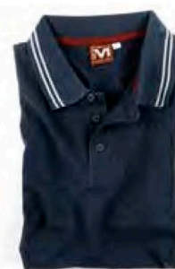
E0405DB BLU NAVY/BIANCO