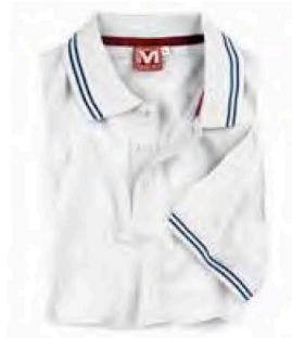
E0405BI BIANCO/BLU NAVY