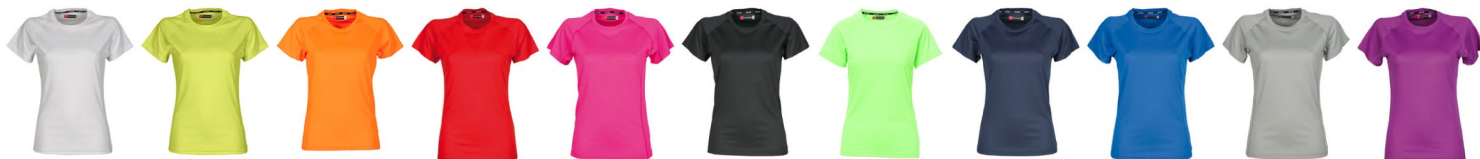
BIANCO GIALLO FLUO ARANCIONE FLUO ROSSO FUXIA FLUO NERO VERDE FLUO BLU NAVY BLU ROYAL GRIGIO CHIARO SUMMER VIOLET