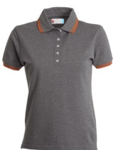
GRIGIO MELANGE/ ARANCIONE