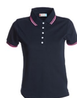
BLU NAVY/FUXIA NEON