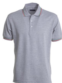
GRIGIO MELANGE /ITALIA