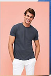
SOL'S REGENT 11380